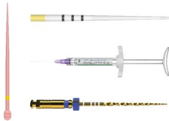
Abb. 1: ProTaper Ultimate ist die vierte Generation des flexiblen Endo-Feilensystems von Dentsply Sirona und umfasst ProTaper Ultimate Papierspitzen, den AH Plus biokeramischen Sealer, die ProTaper Ultimate Handfeile und ProTaper Ultimate Guttapercha (von oben nach unten).

steht auf der Website zum Download bereit.